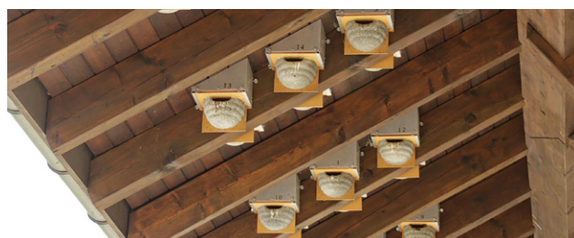
Vogelfreundlich – Kunstnester fassadenschonend an Querbalken montieren.