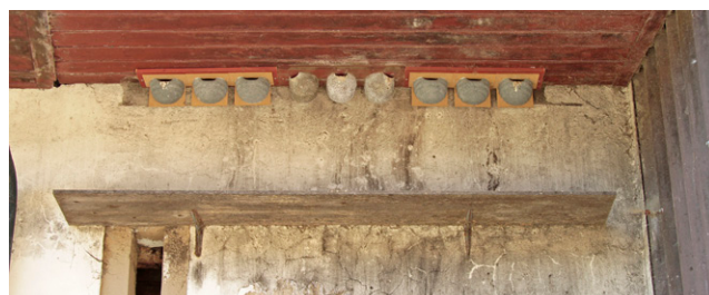
Vogelfreundlich – Kotbrett unterhalb von Kunstnestern.

Die Jungen der Zweit- oder Drittbruten werden aufgezogen.