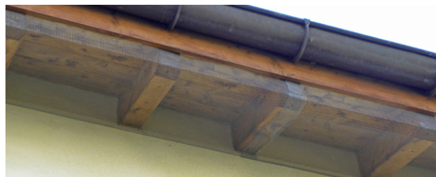
Vogelfreundlich – über heiklen Bereichen einen Fassadenschutz anbringen.