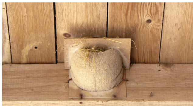
Wegen des Abstandes zur Decke sind hier anstelle von Mehlschwalben Spatzen eingezogen, daher: Mehlschwalbennester bündig am Unterdach anbringen.

Ob und wie Schwalbenkot dauerhafte Schäden an Fassaden verursacht, ist bisher noch nicht untersucht, hängt aber vermutlich von der Art der Fassade ab. Eine Reinigung der Fassade mit Wasser reicht jedoch oft, um den Kot zu entfernen.