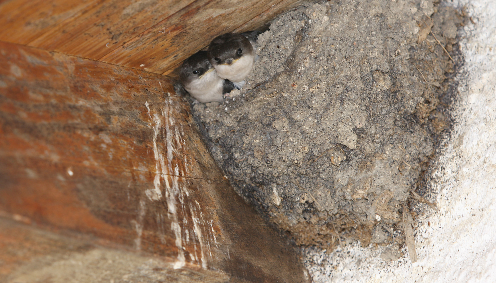
Mehlschwalbenest an Hausfassade