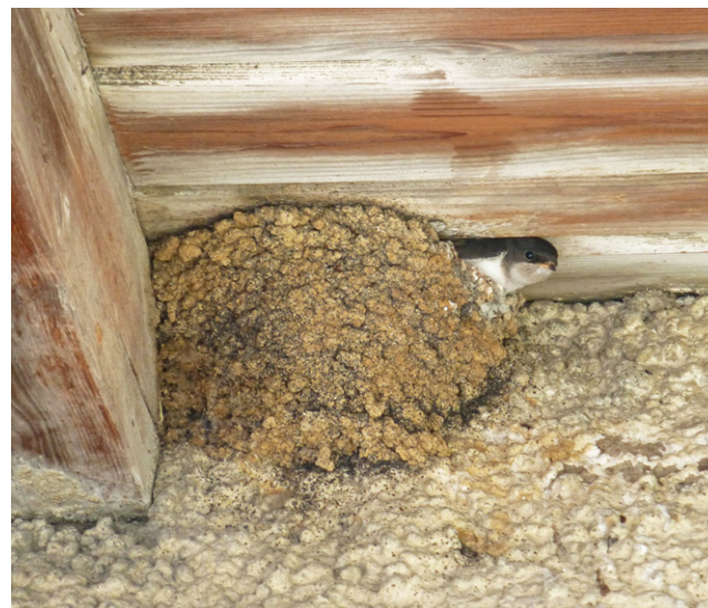
Typisches Fassadennest der Mehlschwalbe.